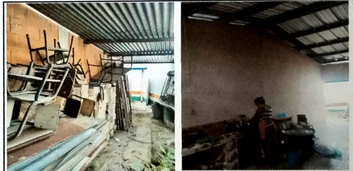
Foto 10: Vista interna de cocina con mueble de concreto y aplicación de azulejo