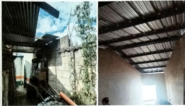
Foto 7: MODULO DE COCINA Vista Interna cubierta de lamina troquelada cal 26 y estructura metalica a base de costaneras. Muros con aplicación de acabado repello + cernido y pintura final.