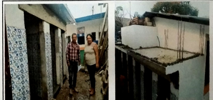
Foto 12: Vista de proceso constructivo de modulo de servicios sanitarios. Aplicacion de azulejo en muros y fraguado de fundicion de losa en servicios sanitarios.

Lesvia Garcia Firma y sello del Presidente de la OPF