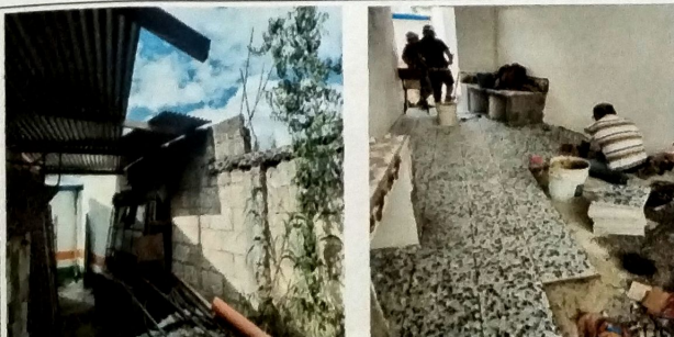
Foto 5: Vista interior de cocina con instalacion de piso de granito