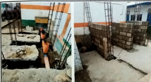
Foto 11: Vista del proceso de modulo de servicios sanitarios, con instalacion de sistema de drenajes.