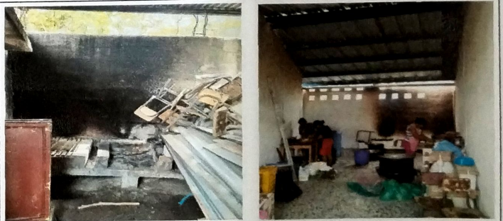
Foto 4: Vista interior de modulo de cocina remozada, con instalacion de piso ceramico, muros con aplicacion de repello + cermido + cubierta de lamina troquelada cal 26 y estructura de metal a base de costanteras.