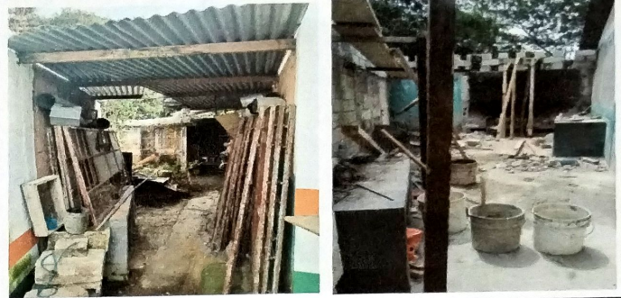
Foto 2: Vista interior del area de cocina done se esta remodelando, al los laterales se puede observar con se tienen los muebles de concreto en etapa de fundicion. Se esta levantadon celosia en pared de fondo.