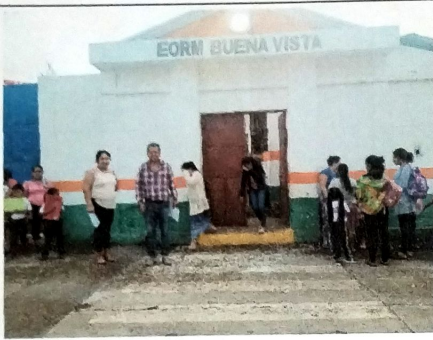
Foto 1: Vista de Ingreso al establecimiento escolar. Con directora del plantel escolar.