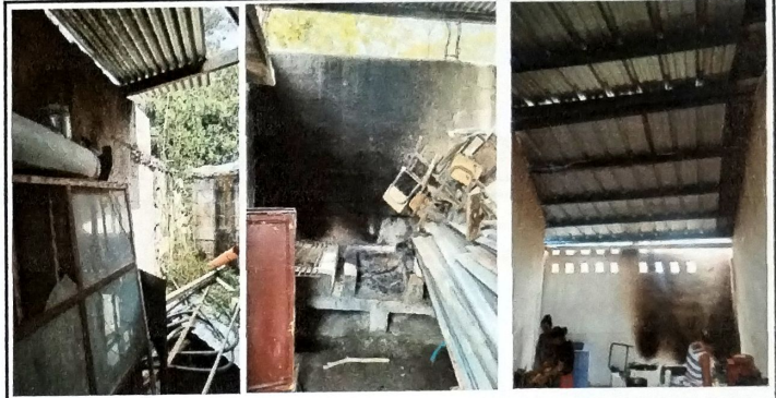
Foto 8: MODULO DE COCINA Vista Interna cubierta de lamina troquelada cal 26 y estructura metalica a base de costaneras. Muros con aplicación de acabado repello + cernido y pintura final.