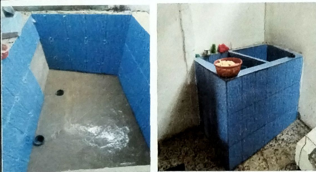
Foto 9: Vista de proceso de ejecución de pila con aplicación de azulejo,