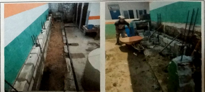
Foto 6: Vista de muro de refuerzo a la par de modulo de aula, vista lateral izquierda y vista lateral derecha.

Leovia Garcia Firma y sello del Presidente de la OPF